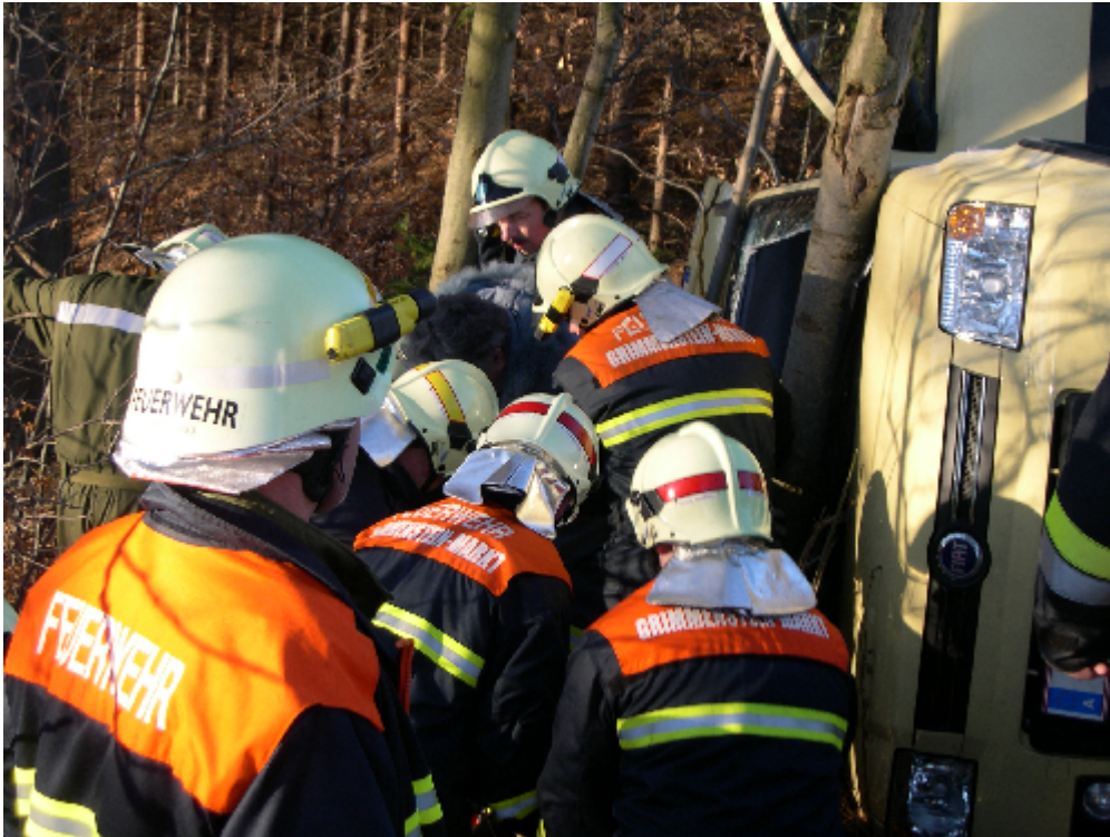
Technischer Einsatz mit Menschenrettung Hoheggerstraße 10. Februar 2007

PKW prallt wegen Glätte gegen Betonleitwand, kommt ins Schleudern und landet auf der Fahrerseite.