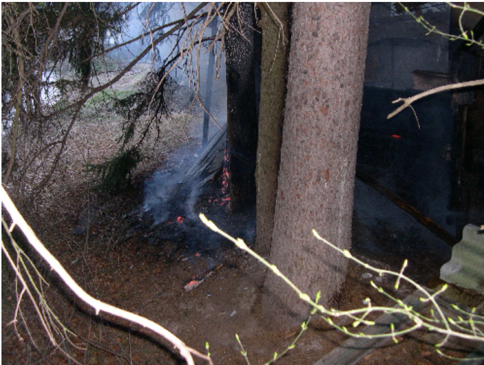
Brandeinsatz in Grimmenstein 7. März 2007

PKW prallt wegen Glätte gegen Betonleitwand, kommt ins Schleudern und landet auf der Fahrerseite.