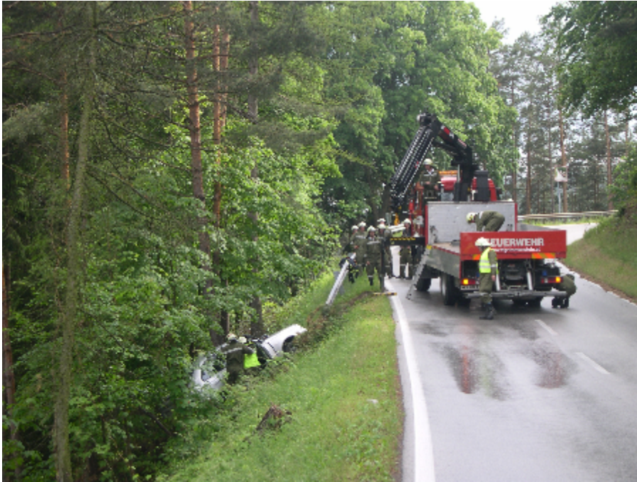
Technischer Einsatz mit Menschenrettung, Hoheggerstraße 3. Juni 2007

Fahrzeug liegt im Straßengraben, die Lenkerin ist noch im Fahrzeug. Die unverletzte Lenkerin wird aus dem Fahrzeug befreit.