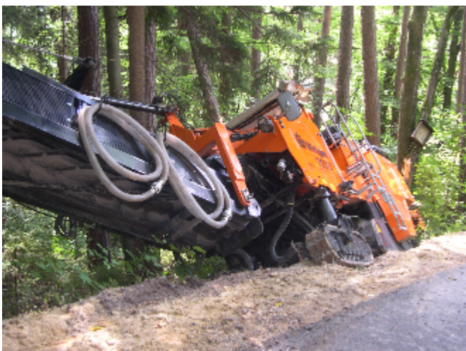
Technischer Einsatz Kunstgraben 10. August 2007

Zwei PKW stoßen frontal aufeinander. Drei Schwerverletzte werden aus den Fahrzeugen befreit.