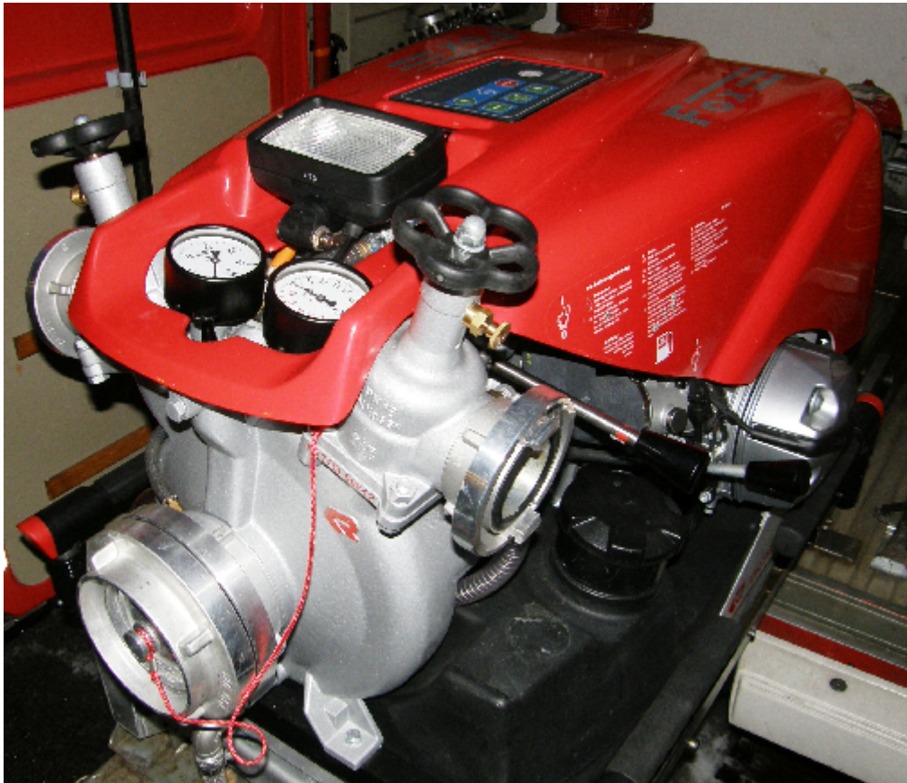
Die neue TS Rosenbauer Fox III – geliefert im März 2007

Die Freiwillige Feuerwehr Grimmenstein-Markt berichtet über den Zeitraum 1. Jänner 2007 bis 31. Dezember 2007